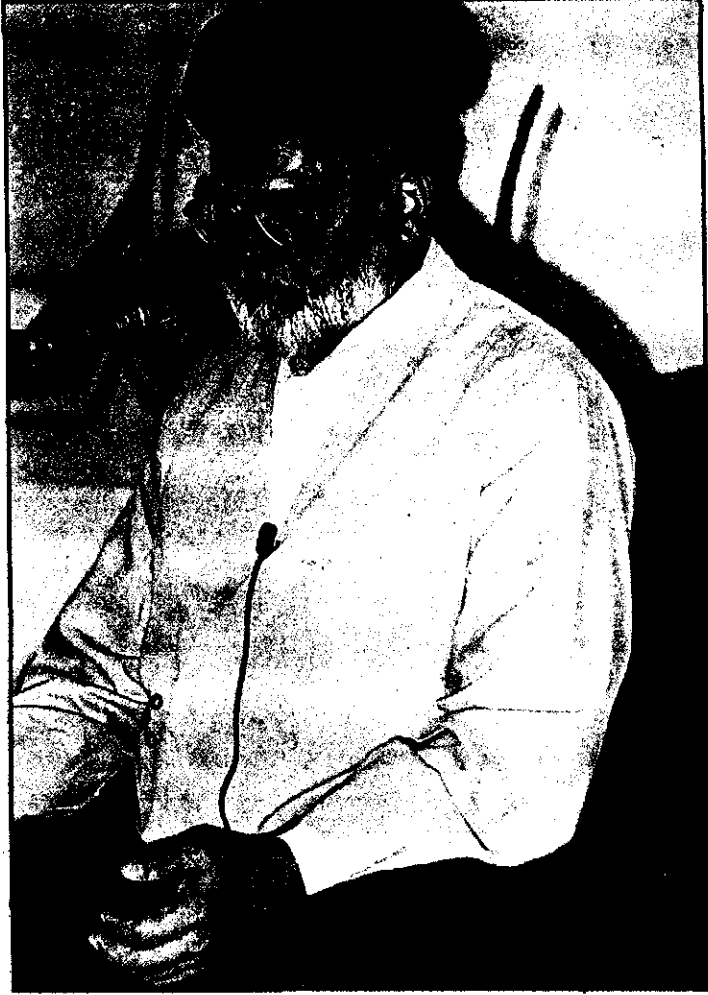
علامہ السید زیشان حیدر جوادی

پاکستان میں اس کتاب کے حقوق اشاعت محفوظ ایک ایجنسی، امام بارگاہ شاہ نجف، مارٹن روڈ کے نام محفوظ ہیں۔